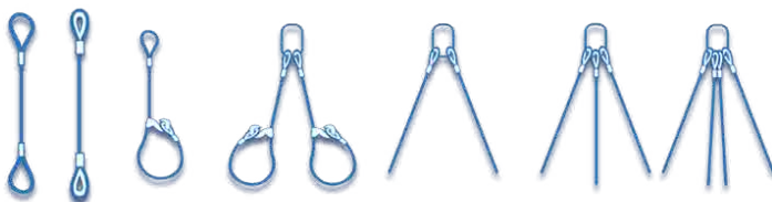
Laço OK e OK-1 1 perna CMT (kgf)

Disponíveis nos diâmetros 6,35 mm a 51 mm de 1 a 4 pernas, correspondendo às capacidades de carga de 300 kgf a 58.100 kgf.